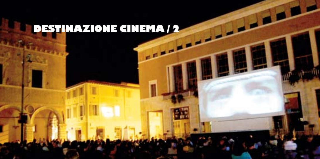
Piazza del popolo a Pesaro.